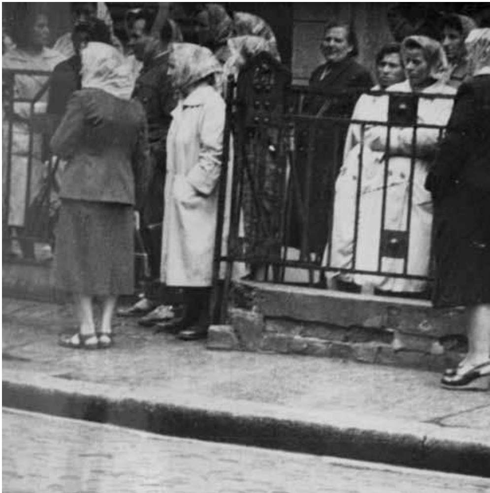
Grupa kobiet przy wejściu do Domu Katolickiego, 30 maja 1960 r., godz. 10.40

zielonogórskim. „Trójka ds. kleru”, jako tzw. „czynnik polityczny” utworzony na mocy decyzji Egzekutywy KW PZPR, wykorzystywała do swych działań specjalną grupę zorganizowaną w ramach Samodzielnego Referatu, a następnie Wydziału IV Komendy Wojewódzkiej MO w Zielonej Górze, która prowadziła działania operacyjne przeciwko Kościołowi - walkę z wszelkimi przejawami życia religijnego, koordynowaną przez Departament IV MSW.